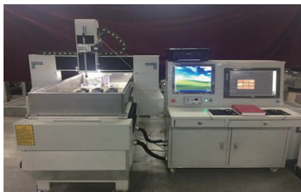
高精度特征成像系统